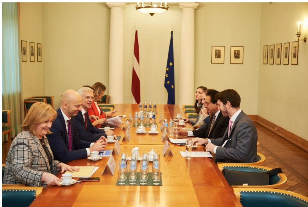
OGP vadītāja Sanjay Pradah tikšanās ar Ministru prezidentu Krišjāni Kariņu 2019. gada 4. decembrī